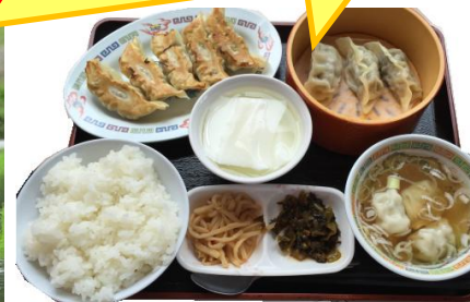
宇都宮餃子と美味しいごはん