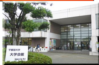
宇都宮大学講演会会場