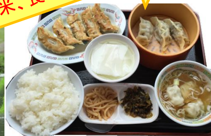
宇都宮餃子と美味しいごはん