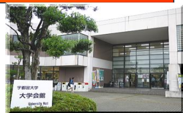
宇都宮大学講演会会場